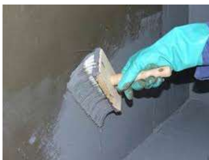
Figura 3 - Aplicação da argamassa polimérica