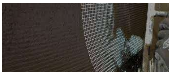
Figura 2 - Tela de poliéster (reforço)