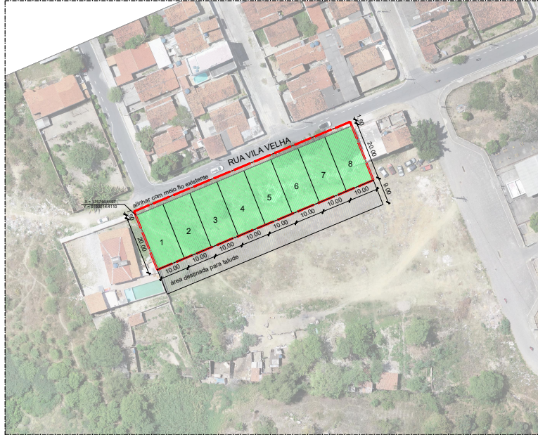
02 Planta Situação ESCALA: 1/1000